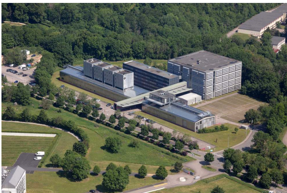
Site de l'INIST